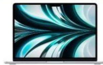
MacBook Air 13,6/M2/8/256GB